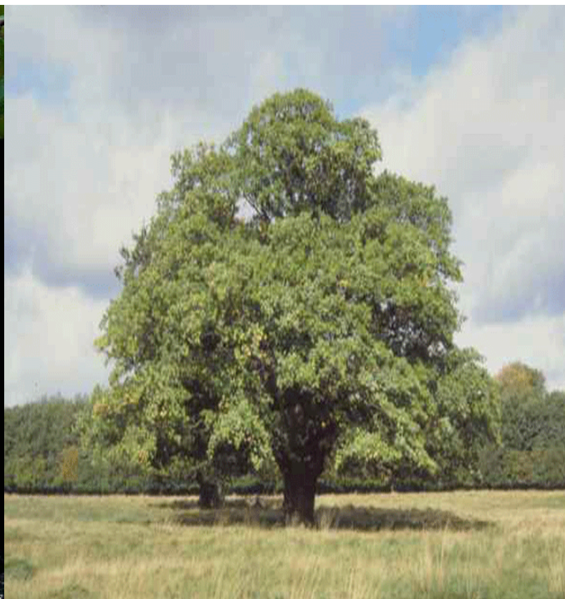
פרופ' שלמה בק המכללה האקדמית לחנוך ע"ש ק"י, באר-שבע